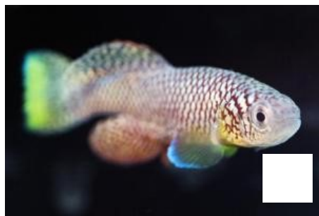
Nothobranchius furzeri Fisch altert im Zeitraffer - Wissenschaftler sind begeistert

Beim Vergleich junger und alter Mäuse fanden die Forscher bei den alten Tieren höhere Monozytenzahlen im Knochenmark und im Blut. Erhöht waren auch die Level zweier entzündungsfördernder Signalstoffe: Tumornekrosefaktor (TNF) und Interleukin-6 (IL-6) im Blut. Diese Stoffe fand man nicht nur bei den Mäusen, sondern auch bei älteren Menschen.